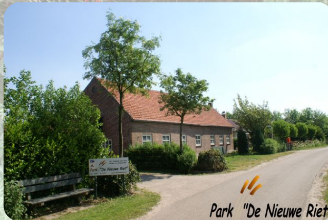
Park "De Nieuwe Riet"

Het Laarzenpad is een stukje schitterend ongerept natuurgebied wat zeker de moeite waard is om eens te bezoeken.